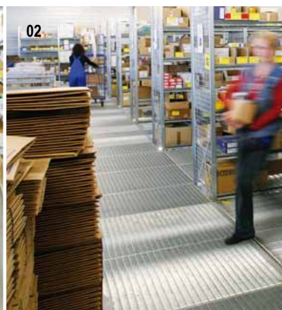
02 Da geht einiges: Insgesamt 1.200 Mitarbeiter wickeln pro Jahr über 3,7 Millionen Bestellpositionen ab.