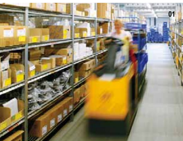
01 Bei Rexel brummt es: Mit 48 Flurförderfahrzeugen werden die Waren kommissioniert.

Leistung: bis zu 20.000 Bestellpositionen täglich