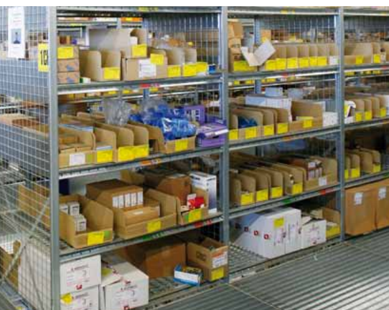
03 Beeindruckende Bilanz: Die möglichen Zugriffe wurden gegenüber dem alten Lager auf bis zu 15.000 pro Tag verdoppelt.